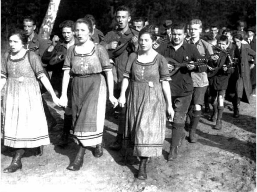
Abbildung 7: Wandervögel unterwegs (Berlin, um 1921)